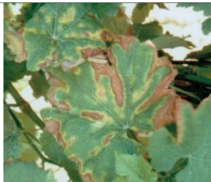
Sintomi di mal dell'esca su foglia di vite.

I dati in nostro possesso richiedono ulteriori conferme e sono originati da applicazioni di agenti biologici in diversi momenti del processo di costituzione delle barbatelle. In particolare, sono emersi aspetti associati alla qualità, quali ad esempio